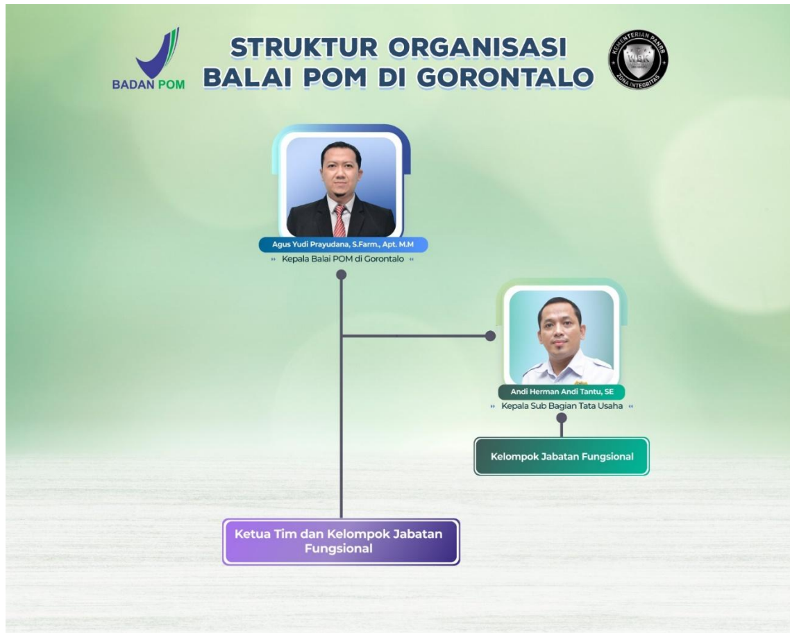
Gambar 1.1 Struktur Organisasi BPOM di Gorontalo